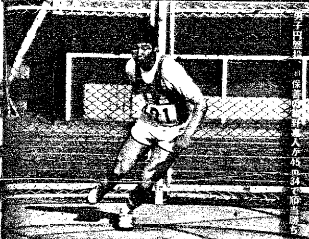
男子1000m 保善の新人が15m34で相当勝ち